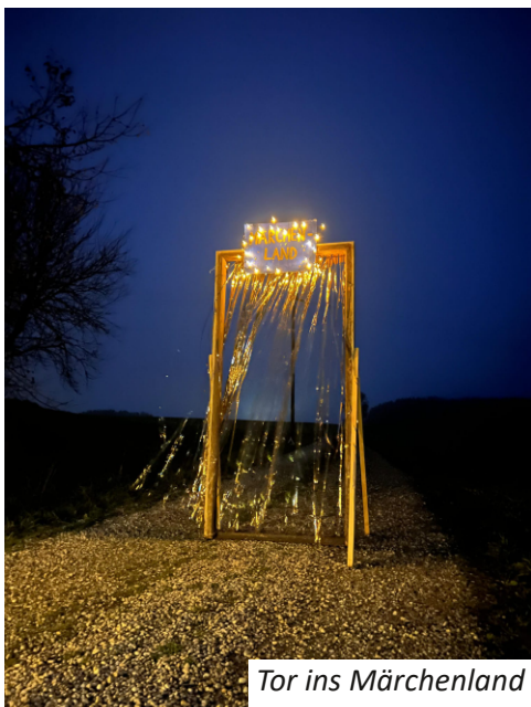
Tor ins Märchenland