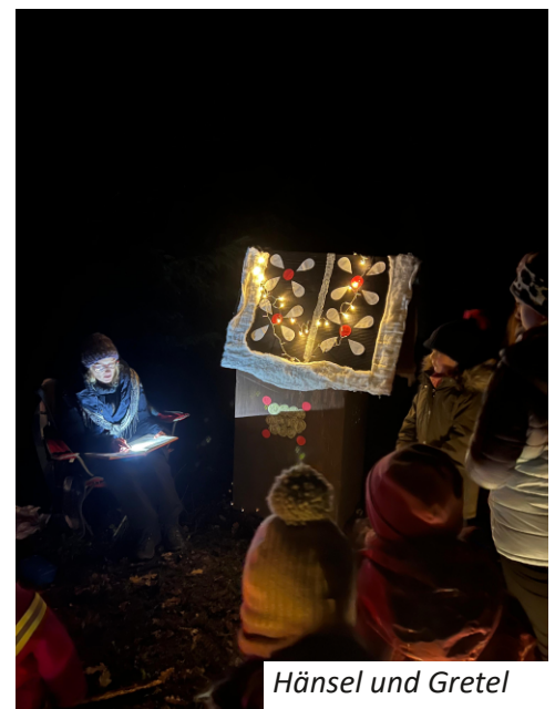
Hänsel und Gretel