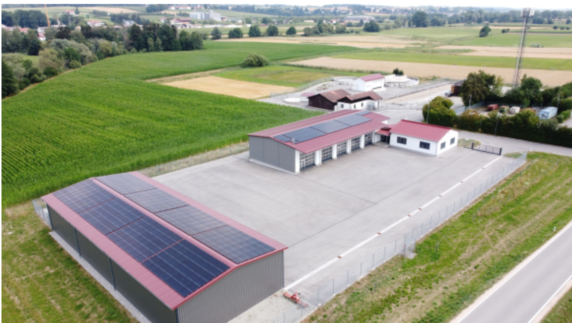
Der Bauhof in der Eggenfeldener Straße liegt direkt neben der Kläranlage und dem Wertstoffhof.

Ein ausdrücklicher Dank gilt den Feuerwehren Unterdietfurt und Huldessen sowie dem Kath. Frauenbund Unterdietfurt, die in bewährter Weise die Bewirtung erstklassig organisiert hatten. Die angebotenen Speisen und Getränke fanden ebenso wie Kaffee und Kuchen reißenden Absatz.