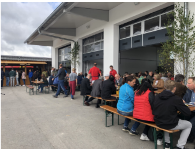
Großes Interesse fanden die Führungen durch Bauhof und Kläranlage. Hier erläutert Kläranlagenbetreuer Horst Eger den Besuchern die Funktionsweise der Kläranlage.