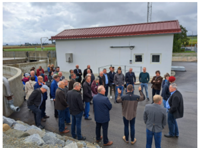
Die vielen Besucher fanden in der Halle nicht mehr ausreichend Platz und ließen sich die angebotenen Speisen und Getränke sowie Kaffee und Kuchen schmecken.