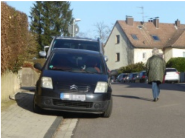
Gehwege werden angelegt, damit Fußgänger nicht auf der gefährlichen Fahrbahn laufen.

Die Gemeinde Unterdietfurt weist darauf hin, dass das Parken auf Gehwegen verboten ist. Fahrzeugfahrer müssen mit einem Bußgeld von mindestens 55 € rechnen. Sollten Fußgänger hierdurch behindert werden oder das Fahrzeug länger als eine Stunde geparkt werden, kommt es neben einem erhöhten Bußgeld auch zu einem „Punkt“ in Flensburg. Zur Beseitigung einer Behinderung auf Gehwegen kann das Fahrzeug jederzeit kostenpflichtig abgeschleppt werden.