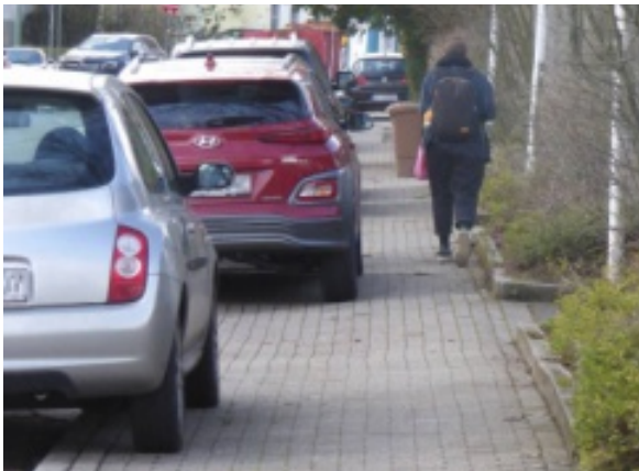
Gehwegparker belegen Straßenraum, der für Fußgänger vorgesehen ist.

Die Gemeinde Unterdietfurt weist darauf hin, dass das Parken auf Gehwegen verboten ist. Fahrzeugfahrer müssen mit einem Bußgeld von mindestens 55 € rechnen. Sollten Fußgänger hierdurch behindert werden oder das Fahrzeug länger als eine Stunde geparkt werden, kommt es neben einem erhöhten Bußgeld auch zu einem „Punkt“ in Flensburg. Zur Beseitigung einer Behinderung auf Gehwegen kann das Fahrzeug jederzeit kostenpflichtig abgeschleppt werden.