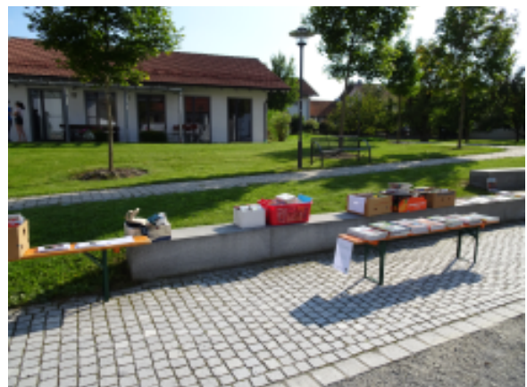
Bei der Corona-Impfaktion im Feuerwehrhaus wurde ein Bücher-Flohmarkt aufgebaut