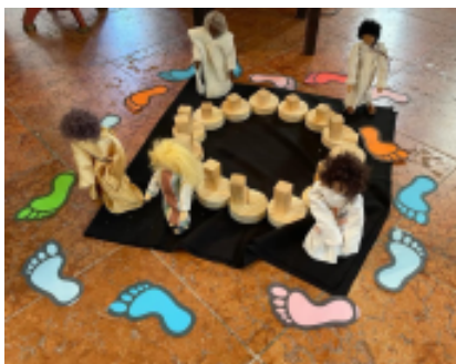
Die Jünger tragen die Botschaft Jesu in die Welt

„Aus dem Schneckenhaus kommen mit Gottes Kraft“ – unter diesem Motto lud der Kindergottesdienstkreis Unterdietfurt am Pfingstsonntag zu einer Andacht ein. Die Besucher hörten die Geschichte vom Heiligen Geist, der wie ein Sturm an Pfingsten über die Jünger Jesu kam und ihnen die Kraft und den Mut gab, die Botschaft Jesu weiterzugeben und in die Welt zu tragen. Zuvor hatten sie sich nur hinter verschlossenen Türen und hohen Mauern getroffen, aus Angst vor Verfolgung. Wie den Heiligen Geist können wir auch den Wind nicht sehen oder fassen. Aber wir sehen, was er kann und bewirkt. Er kann Segelboote in Bewegung bringen und trägt die Samen der Pflanzen von Ort zu Ort. Außerdem treibt er Windräder an. Um der Kraft des Windes nachzuspüren, bekam jedes Kind zum Abschluss der Andacht eine Bastelanleitung für ein Windrad mit nach Hause.