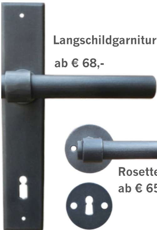
Langschildgarnitur ab € 68,-