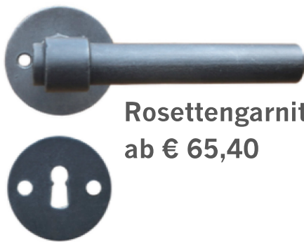
Rosettengarnitur ab € 65,40