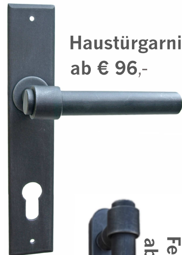
Haustürgarnitur ab € 96,-