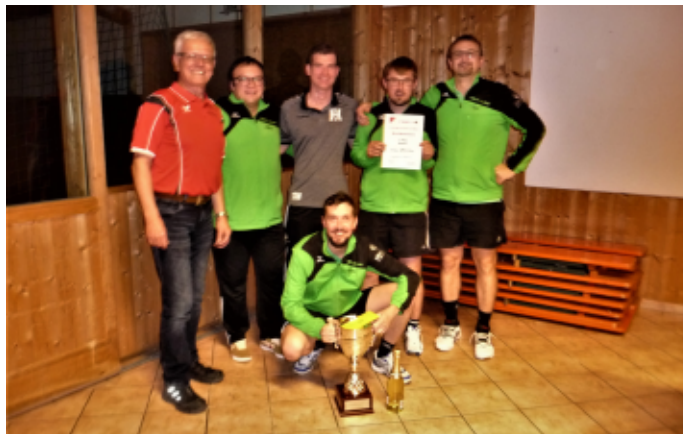
Crazy SVH Boys