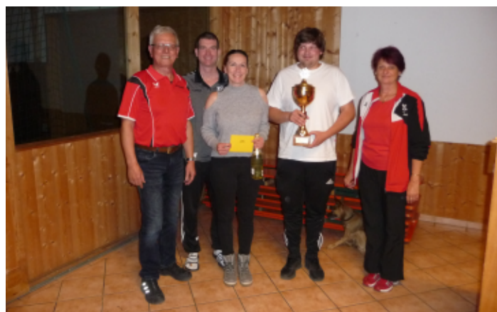
Team Gruber Stahlbau