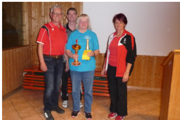
Volksradfahrer Damen 2

Ebenfalls geehrt wurden die besten Einzelspieler der Vorrunden in den einzelnen Gruppierungen.