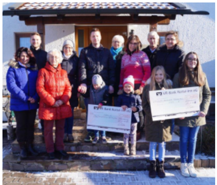
Die Anwohner von Bergstraße und Bergring mit den symbolischen Schecks.

Der Reinerlös von 2000 Euro geht wieder zu gleichen Teilen an die Kinderkrebshilfe Rottal-Inn und an die Palliativstation der Rottal-Inn Kliniken.