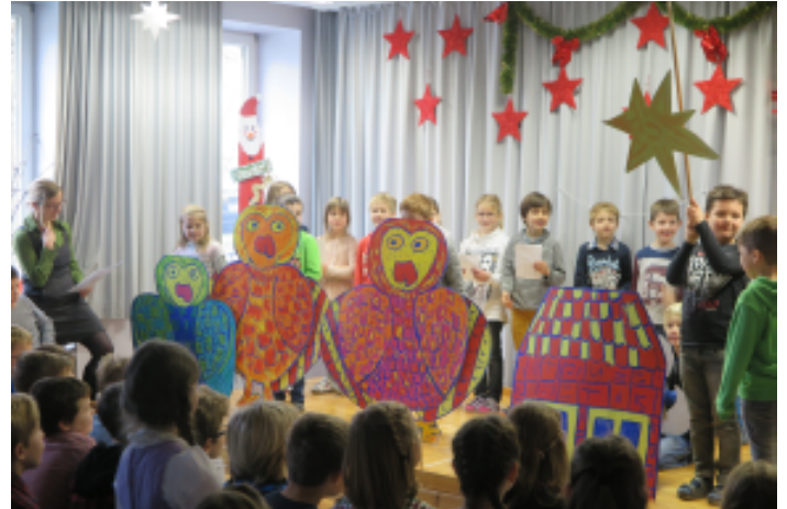
Die Kinder der 1. Klasse sangen und spielten das Lied von den drei Eulen.