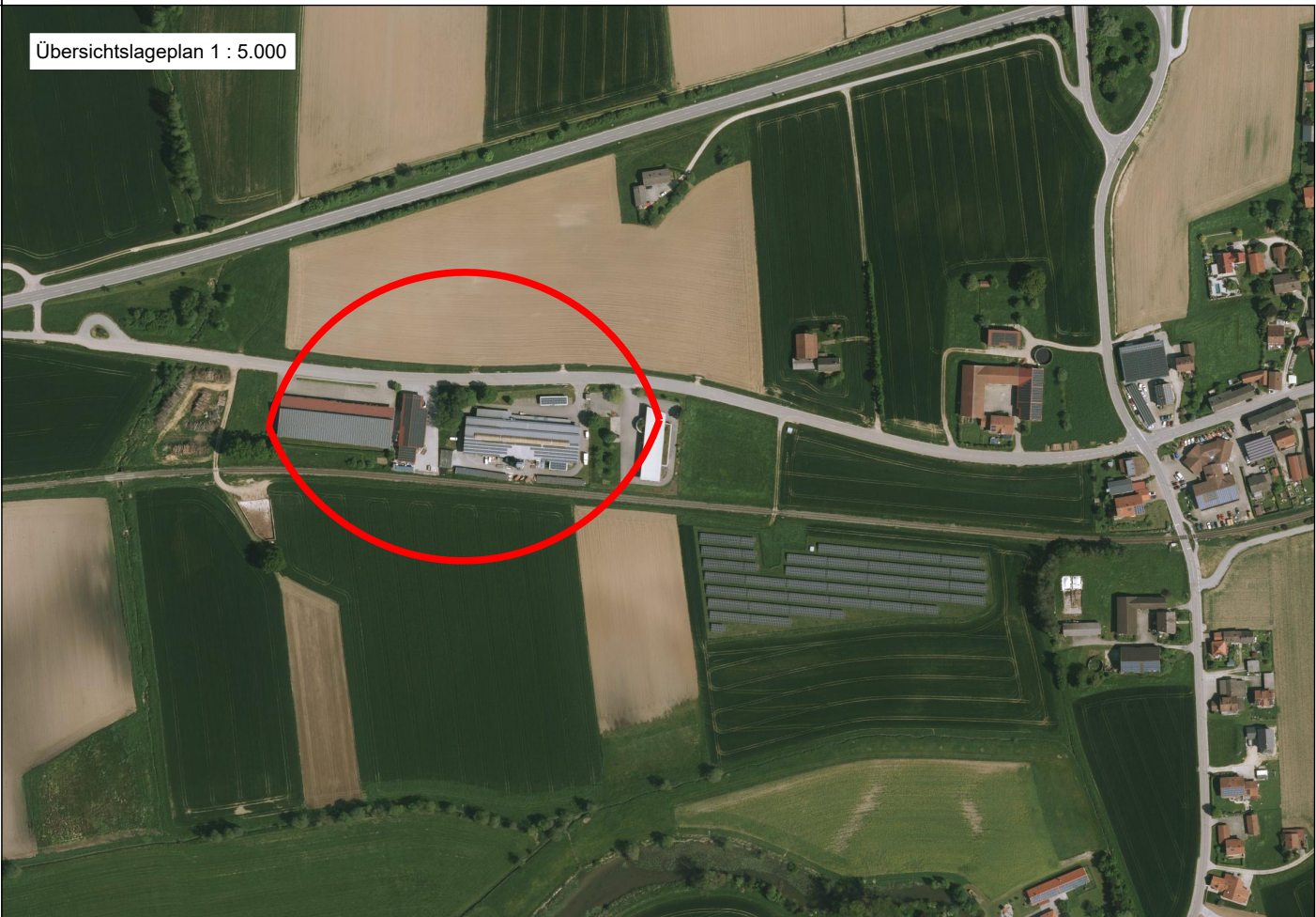
Übersichtslageplan 1 : 5.000

Der beiliegende Abbuchungsplan zum Ökokonto "Stummerwiesen" der Gemeinde Unterdietfurt ist Bestandteil der Änderung des Bebauungsplanes Gewerbegebiet Vordersarling West mit integrierter Grünordnung durch Deckblatt Nr. 3.