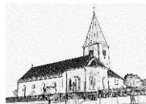
St. Martinus Geratskirchen