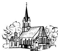
Mariä Heimsuchung Unterdietfurt