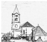
Johannes d. Täufer Mitterskirchen