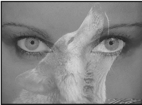
Jeder Mensch trägt eine tiefe Sehnsucht in sich. Manchmal versteckt sie sich. Nur selten können wir sie in den Augen des anderen ablesen.