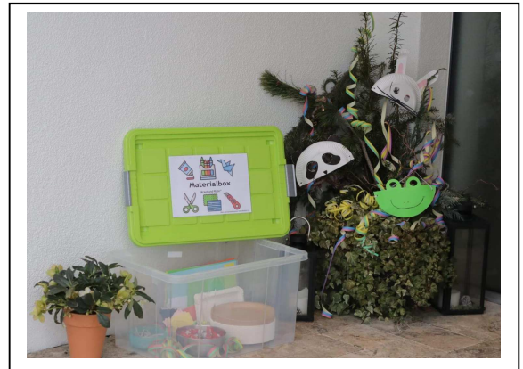
Materialbox im Lindenweg 9a