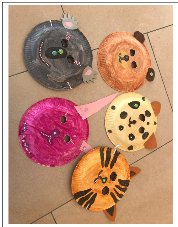
Massenproduktion von Leni u. Leo H.

Und so bastelten die kleinen Mitglieder des Obst- und Gartenbauvereins Unterdietfurt am Unsinniger Donnerstag (11.02.) wie wild Faschingsmasken zu Hause. Via WhatsApp wurden die Ergebnisse in die Gruppe gestellt. Es entstanden: Hase, Frosch, Pandabär, Fuchs, Katze, Kücken und noch viele mehr, aber seht selbst: